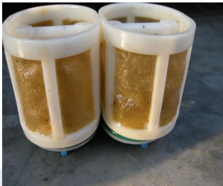
Foto: Voorbeeld verontreiniging filter met micro-organismen.

De inspectie-instelling kan ervoor kiezen het monster zelf te meten of dit te laten doen door een geaccrediteerd laboratorium.