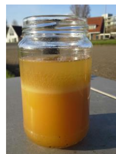
Diesel met microbiologische verontreiniging.

Wanneer de test in een laboratorium wordt uitgevoerd, moet het monster worden behandeld, geconditioneerd en opgeslagen conform de richtlijnen van het laboratorium.