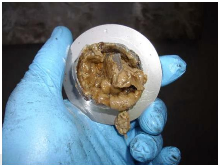
Foto: Voorbeeld micro-organismen in een filtersysteem.